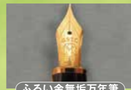
ふるい金無垢万年筆