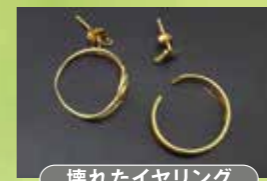
壊れたイヤリング