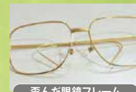
歪んだ眼鏡フレーム